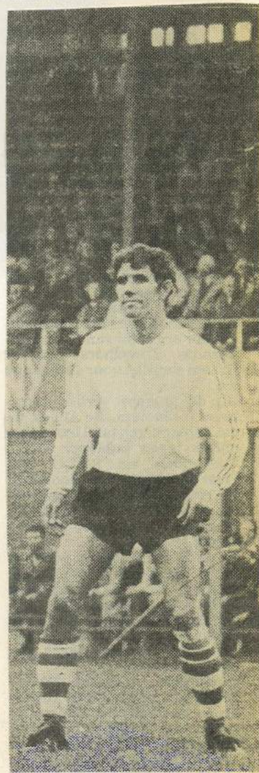
Banhoffer goed spel

SC CAMBUUR: Tukker; Lpez, v. d. Vlag, A. Roosenburg en Van der Land; Zwaan, Ferwerda (Vermeulen en C. Roosenburg); Brinks, De Blaauw (Hazelhof) en De Groot. 4500 toeschouwers. Scheidsrechter: H. Weerink.