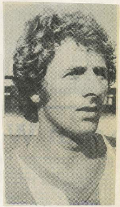
Cees v SLOTEN (2 doelp.)

Voor PEC Zwolle bleef de positieve indruk, dat er niet alleen was gewonnen, maar dat er ook wat meer lijn in het spel zat dan bijvoorbeeld afgelopen woensdag tegen FC Den Bosch. Met nieuwe aanwinst Tjeerd van 't Land op