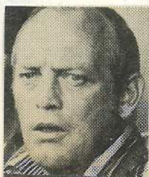
TRAINER ALLEMAN NA KRAPPE 3-2 PEC-ZEGE