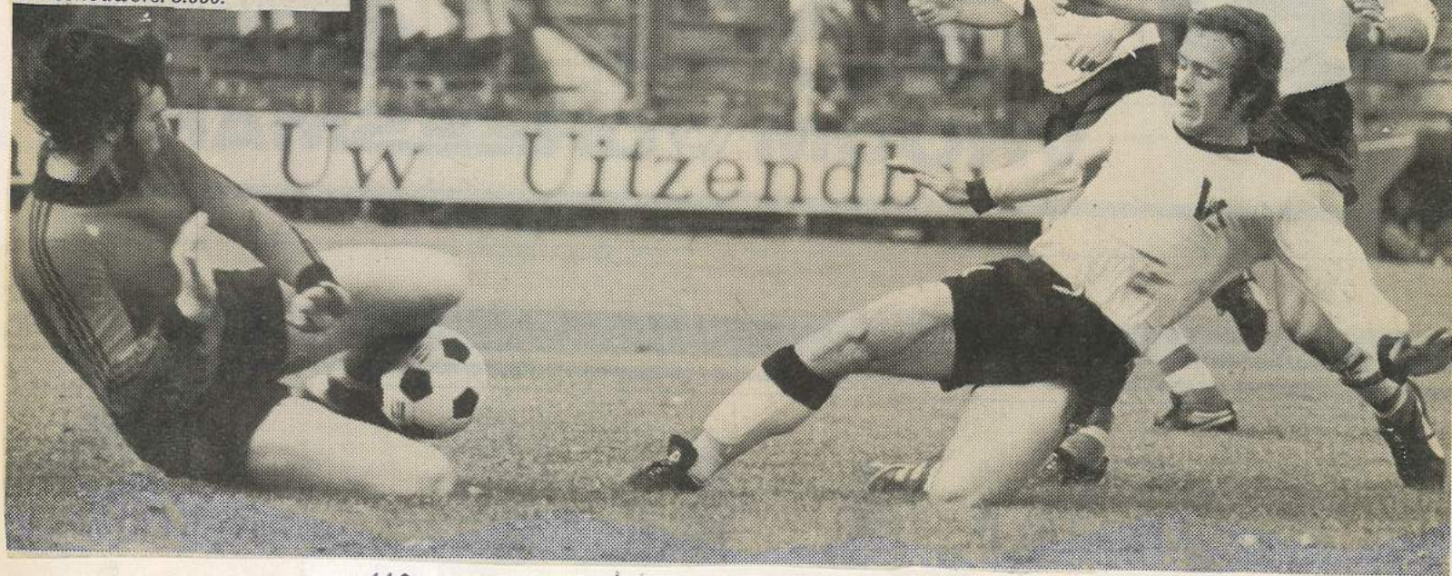
NA ONVERWACHTIGE 0-2 TRIOMF OP VITESSE

Scheidsrechter: Siem Wellinga. Toeschouwers: 5.000.