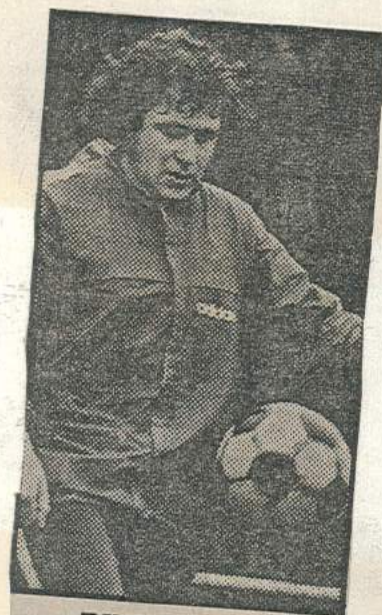
RINUS ISRAËL ... gelijkmaker ...